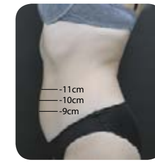
Après 3 mois