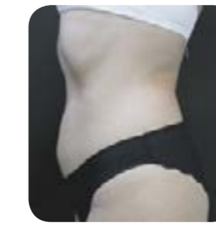
Après 1 semaine