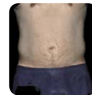
Après 1 mois